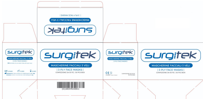
FUSTELLA CONFEZIONE 50 PEZZI