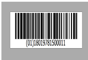
CODICE A BARRE – BOX 50 PEZZI