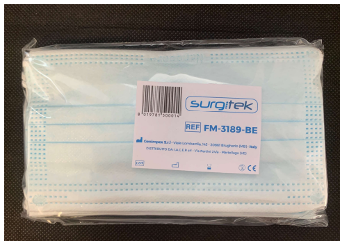
BUSTA DA 10 PEZZI