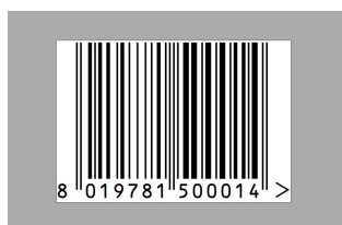
CODICE A BARRE – BUSTA 10 PEZZI